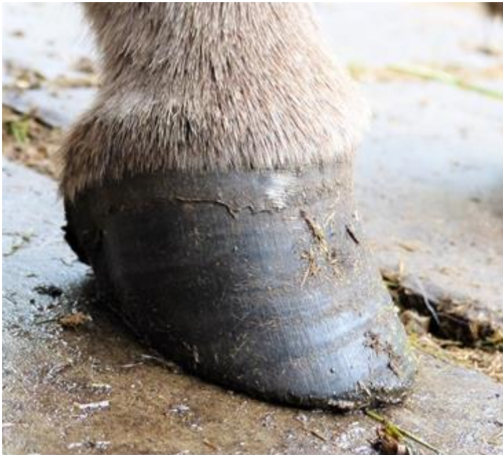
Abb. 7: Korrekte Hufstellung nach Hufpflege