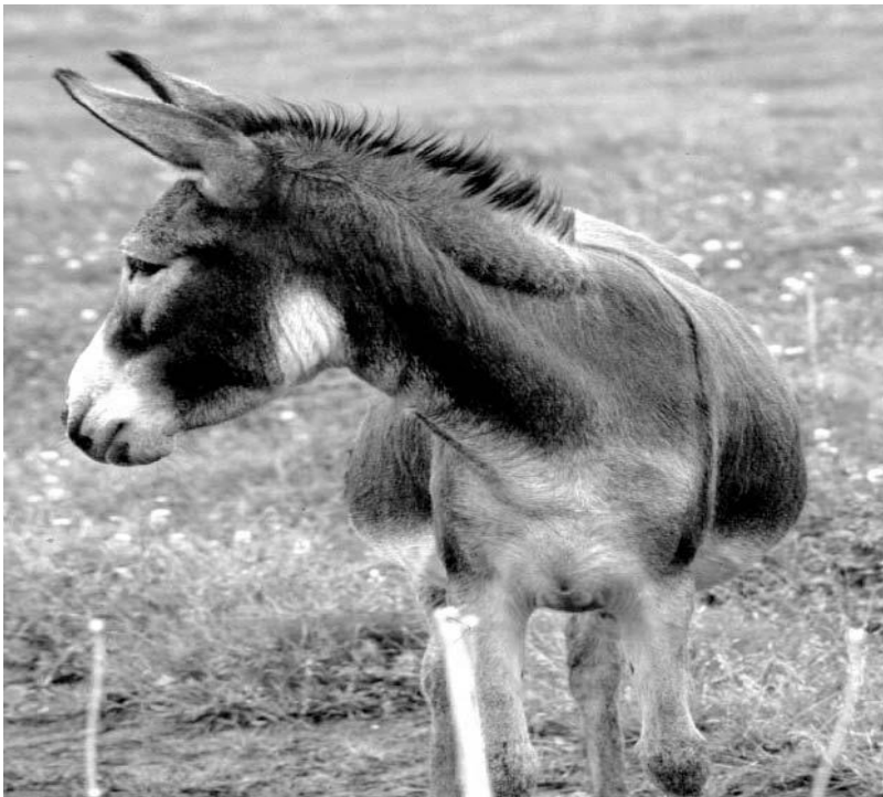
Abb. 3: Bei diesem Esel ist die Einlagerung von Fett in das Bindegewebe am Hals gut zu erkennen, auch wenn der Hals noch nicht „gekippt“ ist. Die üppige Kleeweide im Hintergrund dürfte die Ursache für das Übergewicht sein

Übergewichtige Esel neigen zu Hufveränderungen und Lebererkrankungen. In Deutschland leiden Esel weit häufiger an Über- als an Unterernährung. Die Mehrzahl der Tiere weist bspw. eine unregelmäßige Hufbeschaffenheit als Folge von Energie- und Proteinüberschüssen in der Futterration auf (siehe hierzu auch Kapitel 8.3 Hufpflege). Typische Stellen für Fetteinlagerungen sind der Hals, der sich dadurch zum „Kipphals“ entwickelt und die Lendenregion. Ein hoher Anteil an Bindegewebe in den Fettdepots, der auch nach einem Fettabbau bestehen bleibt, ist für Esel typisch.