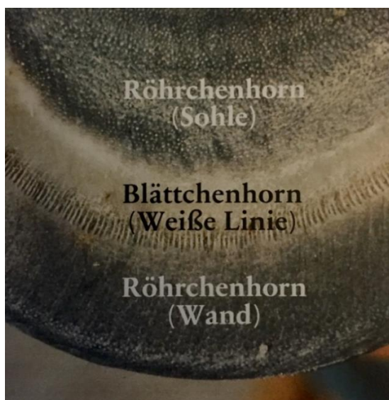
Abb. 9: Huf und Fesselstand,