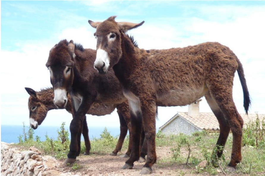
Abb. 2: Esel zeigen eine auffällige Mimik und Körpersprache