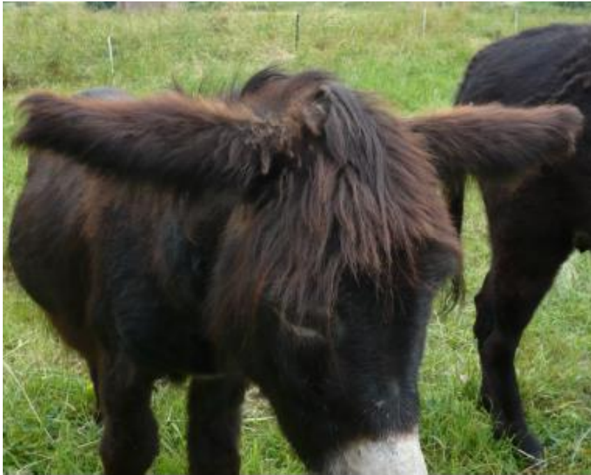
Abb. 8 Helikopterohren

Esel sind von ihrem Naturell her eher duldsam und stoisch. Krankheitssymptome und Schmerzen zeigen sie weniger deutlich als zum Beispiel Pferde. Typisches Ausdrucksverhalten eines kranken Esels sind die hängenden Ohren („Helikopterohren“). Oft werden Schmerzzeichen als „störrisch“ fehlinterpretiert. Deswegen ist oftmals eine frühzeitige Hinzuziehung eines Tierarztes/einer Tierärztin dringend anzuraten.