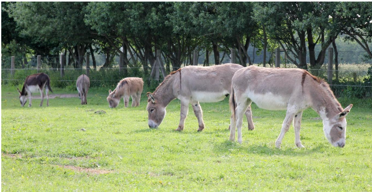
Abb. 1: Eine Vielzahl verschiedener „Eseltypen“ und Farbvarianten kann in Deutschland angetroffen werden

Der züchterische Einfluss auf die heutige Eselpopulation ist unverkennbar. Die meisten Esel haben ein Stockmaß zwischen 95 bis 115 cm. Für Großesel, wie den Baudet du Poitou, ist ein Stockmaß im Mittel von 145 cm („Hengste von 140 bis 150 cm“) im Zuchtstandard festgeschrieben.