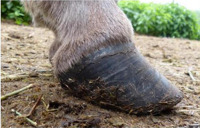
Abb. 6: Esel mit vernachlässigter Hufkorrektur

Ausreichende Bewegung ist für die Erhaltung der Hufgesundheit unerlässlich.