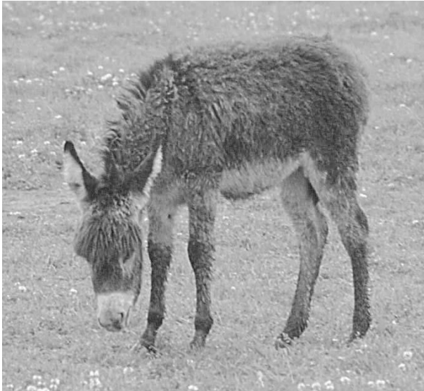
Abb. 5: Das flauschige Fohlenfell saugt sich wie ein Schwamm voll Wasser, wenn das Fohlen nass wird. Leicht kann eine lebensbedrohliche Lungenentzündung die Folge sein