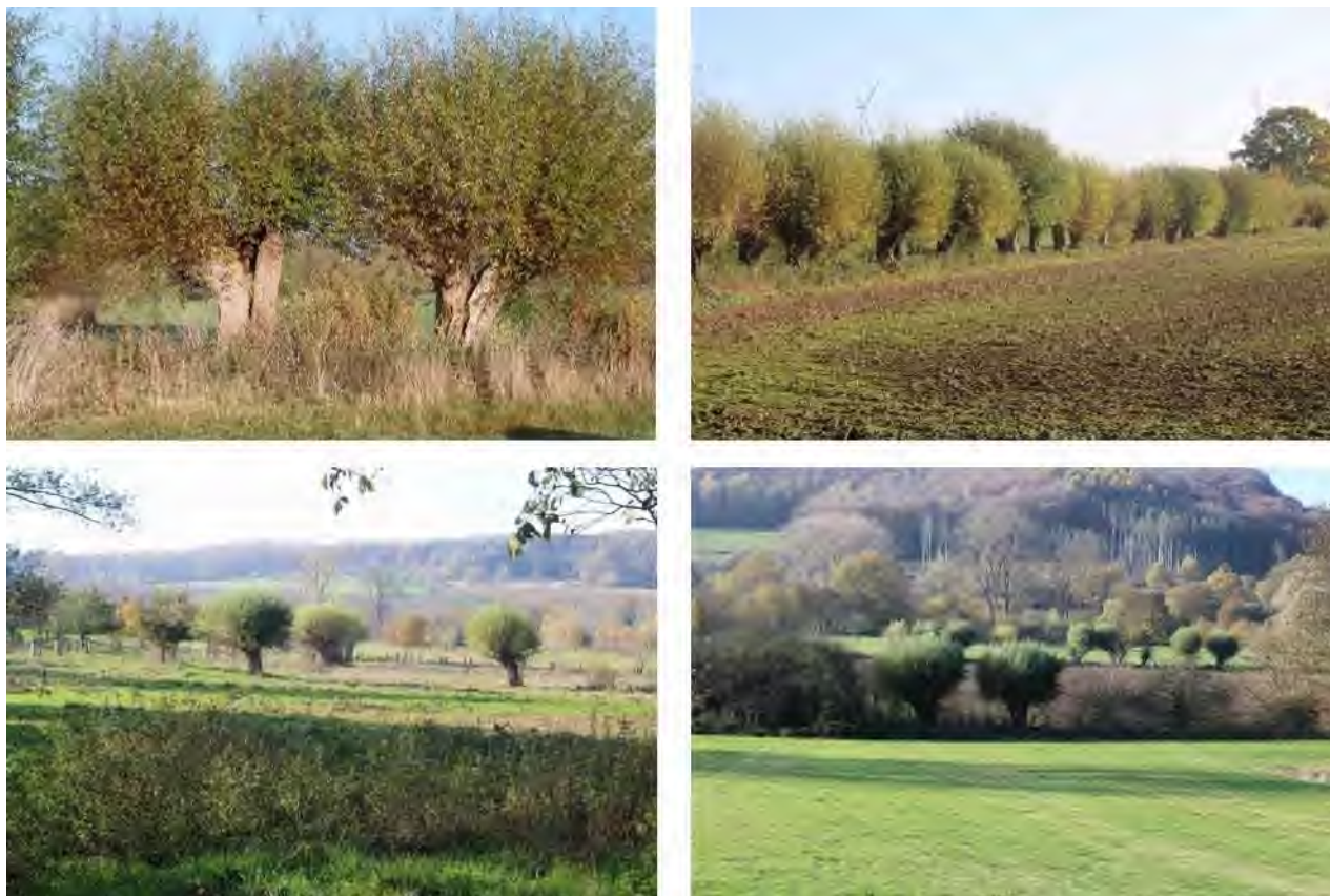
Fotos 2 – 5: Alte Kopfbäume, Kopfbaumreihe südlich der Ortslage Ottenhausen (Kreis Höxter), Kopfbäume im Bereich der Biotopverbundachse und Kopfbäume auf extensivem Grünland (von oben links im Uhrzeigersinn)